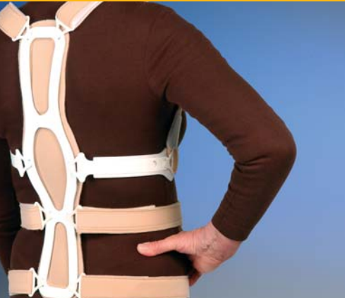
50R20 Dorso Osteo Care