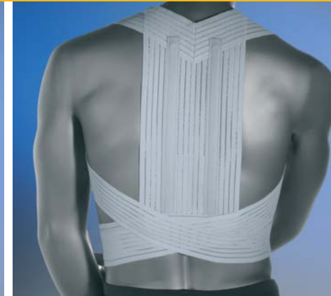
1068 Reggispalle Dosi EQ