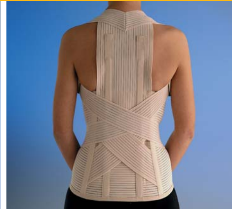
3058 Dosi Cross Dorsolombare